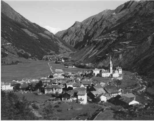
Cogne en 1900

Le «patriarche des poètes valdôtains, notre chantré national», d'après l'expression du chanoine Maxime Durand, naquit à Cogne le 18 mars 1810, dans ce milieu paysan qui sera l'une des principales sources de son inspiration